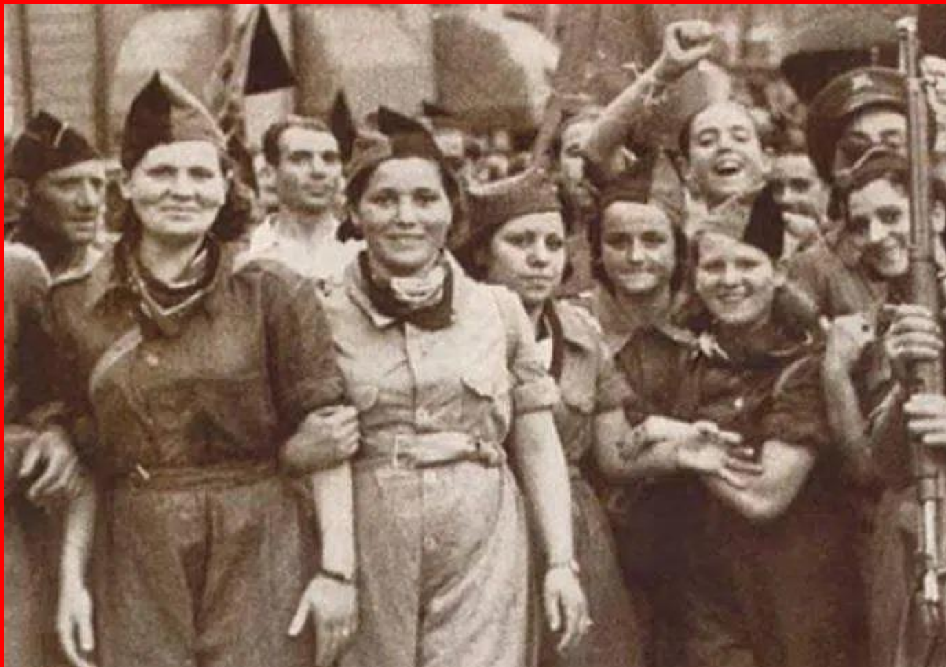
Milicianas en Barcelona

Además, querían convertir las relaciones de pareja en algo público , más allá de la intromisión de la iglesia y denunciaban la violencia machista dentro del hogar. Mujeres Libres reivindicó, desde sus inicios, la incorporación de la mujer al mercado laboral remunerado , la alfabetización de todas las mujeres o la capacitación de las mismas en todos los sectores. Además, no se les escapaba el tema de la conciliación familiar y laboral . Por eso, pusieron en marcha guarderías en los lugares de trabajo y reclamaban la apertura de comedores y guarderías públicas (o populares), algo por lo que aún se sigue luchando.